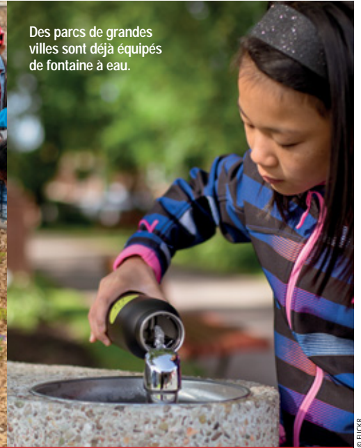
Des parcs de grandes villes sont déjà équipés de fontaine à eau.