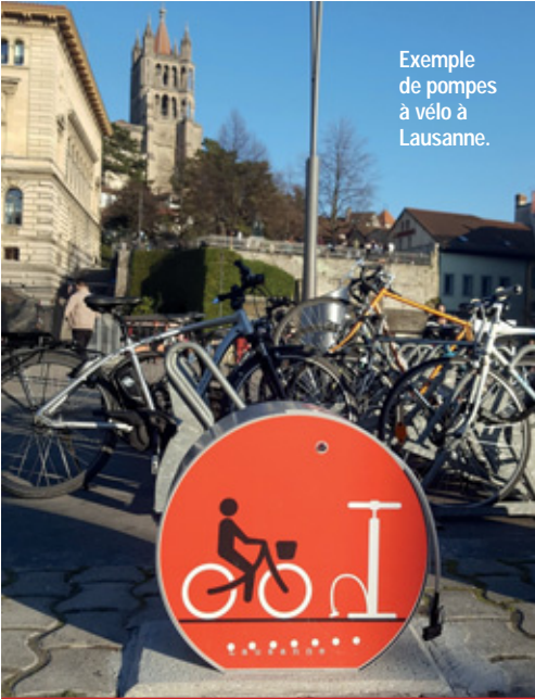
Exemple de pompes à vélo à Lausanne.

Metz : Beaucoup de coureurs empruntent toute l'année ce chemin pour leurs sorties sportives. Malheureusement, pendant la période estivale, aucun point d'eau n'est à leur disposition comme il en existe dans d'autres parcs de grandes villes. Projet jugé réalisable, soumis au vote, retenu et réalisé.