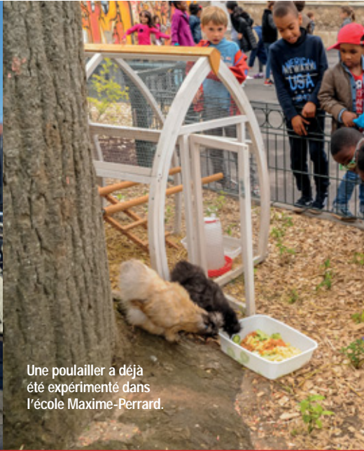
Une poulailler a déjà été expérimenté dans l'école Maxime-Perrard.