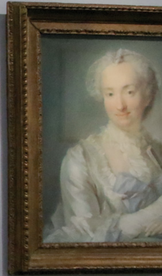
Jean-Baptiste Perronneau Portrait d'une femme en robe bleue et de son serviteur noir Musée des Beaux-Arts d'Orléans 1750 Musée des Beaux-Arts d'Orléans