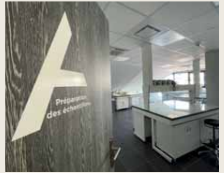
Six laboratoires dernier cri au service de la cosmétologie.