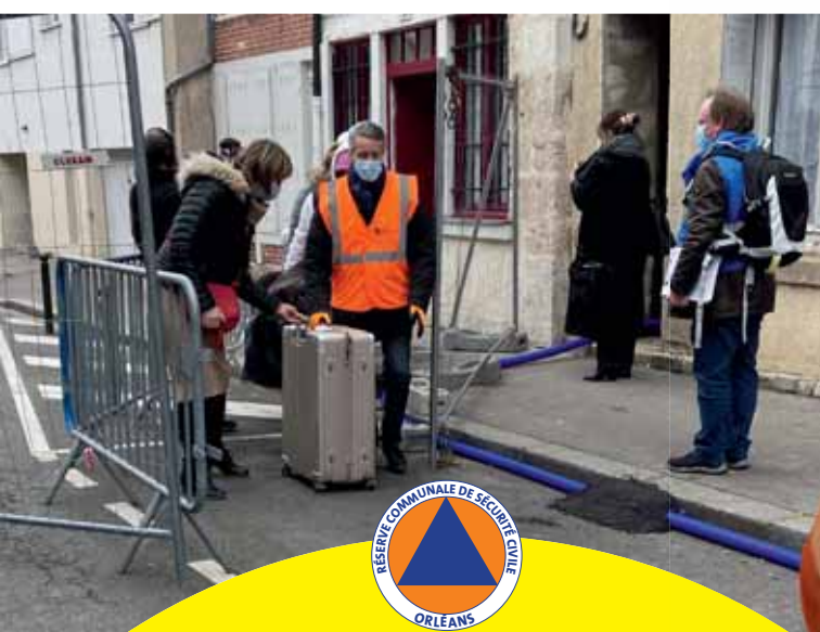
Récemment, les sinistrés de la rue de Bourgogne ont pu récupérer une partie de leurs biens. La réserve était présente pour leur prêter main-forte.