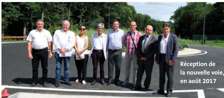
Réception de la nouvelle voie, en août 2017

Menés depuis 2015 par Orléans Métropole, les travaux de requalification et d'aménagement de la rue de la Tuilerie se sont achevés cet été. Ils se sont déroulés en deux phases, entre la RD97 et la rue du Polygone en 2015-2016, puis la rue du Polygone et la RD2020 en 2016-2017. Ainsi, cette liaison traverse les communes de Saran, Fleury-les-Aubrais et Chateau permettant de fluidifier le trafic au nord d'Orléans Métropole tout en sécurisant les liaisons intercommunales. Huit millions d'euros ont été investis par Orléans Métropole dans cet aménagement qui comprenait aussi l'aménagement d'une voie piétons-cyclistes éclairée tout au long de l'itinéraire, la création de giratoires, de signalisation limitant la vitesse à 50 km/h et de plusieurs bassins de rétention pour assurer une meilleure gestion hydraulique. ■