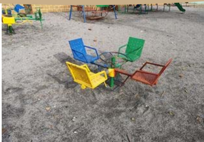
Aménagement de l'espace vert Banikani avec des jeux pour enfants par le prestataire Assous & fils en avril 2020