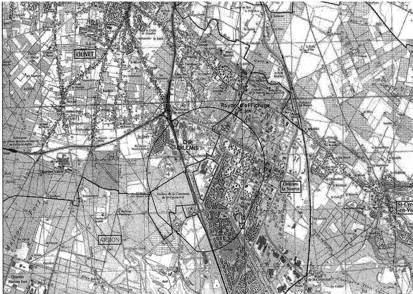
PLAN DE LOCALISATION - Carte IGN n° 2220 O

Périmètre d'affichage autour du C.H.R.O. (Rayon d'un kilomètre)