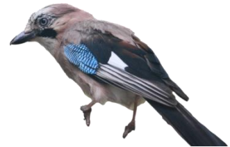
Geai des chênes